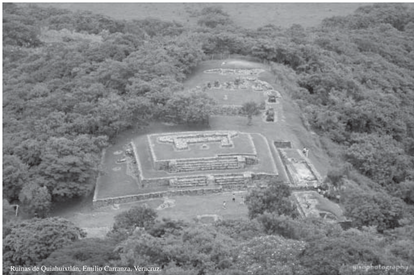
Ruinas de Quiahuixtlán, Emilio Carranza, Veracruz.

De manera directa en la Ley General para la Prevención y Gestión Integral de los Residuos (LGPGIR) art. 7, fracción XVIII manifiesta: « Formular, establecer y evaluar los sistemas de manejo ambiental del Gobierno Federal que apliquen las dependencias y entidades de la administración pública federal » y el Art. 9, del Estado fracción XIV, « Formular,