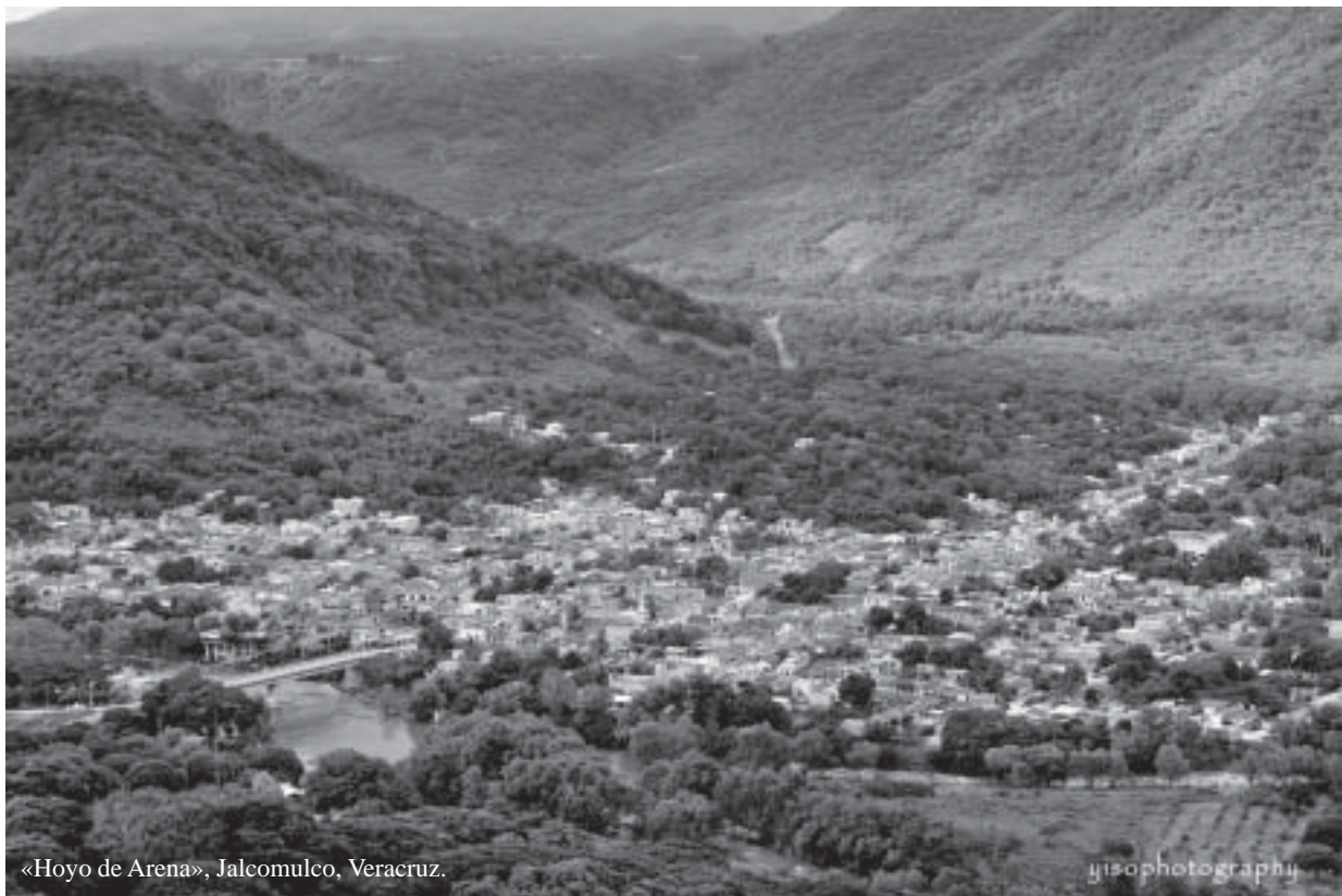
«Hoyo de Arena», Jalcomulco, Veracruz.