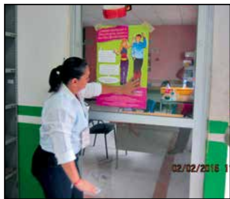
La Delegada en Coatzacoalcos, durante la campaña de difusión publicitaria en la Biblioteca y DIF municipal de Santiago Sochiapan, Ver.