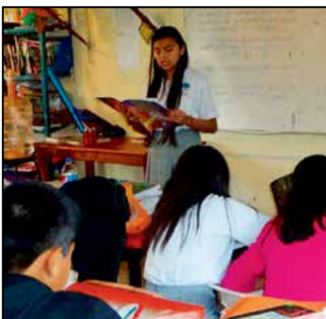
Jóven Promotora de la Telesecundaria "Niños Héroes" de Carrizal, Papantla, Ver., quien participa del Programa Adolescentes Promotores de Derechos Humanos.