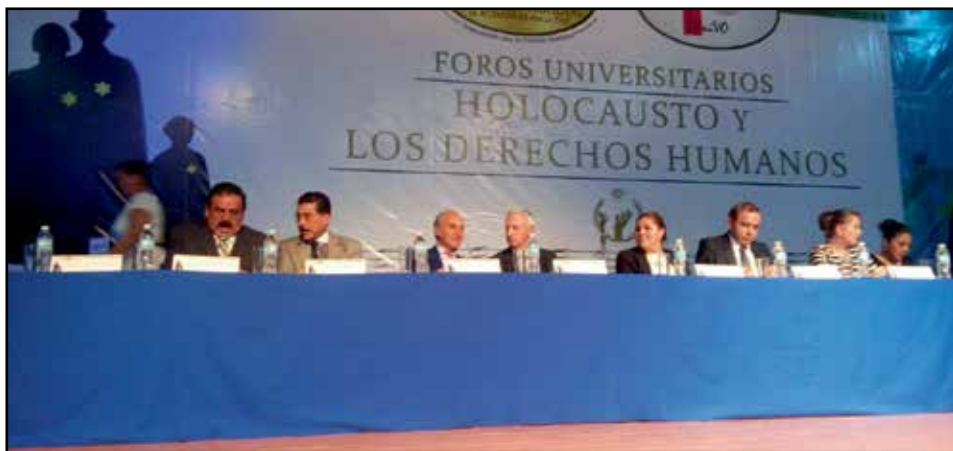
El Presidente de la Comisión Estatal de Derechos Humanos de Veracruz, durante el acto protocolario de inauguración de los Foros Universitarios “Holocausto y los Derechos Humanos” organizado por la Embajada Mundial de Activistas por la Paz.