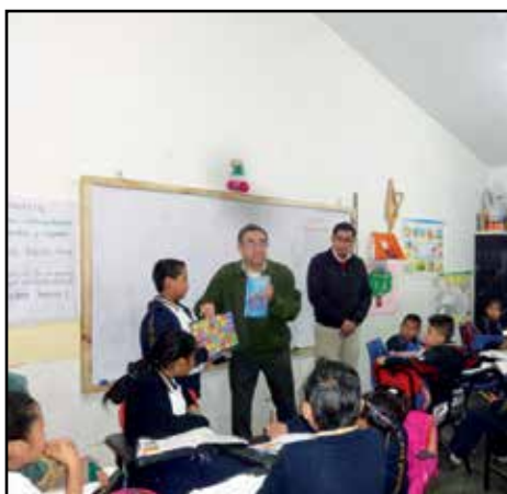
El Delegado en Córdoba, durante la sesión del Programa niños promotores de la Primaria "Hermenegildo Galeana" en Amatlán de los Reyes, Ver.