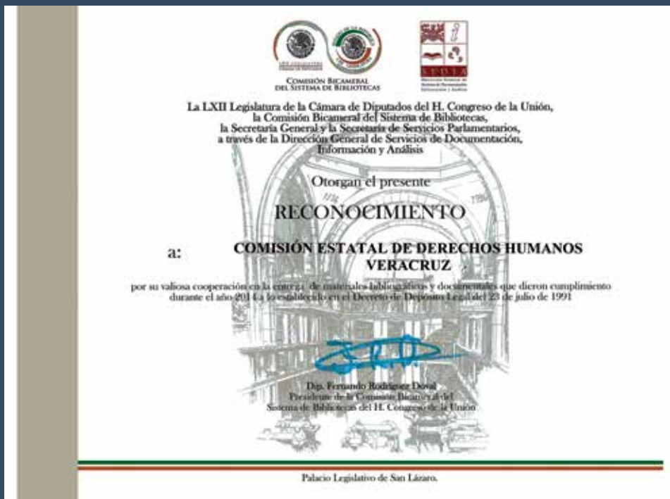
El pasado 24 de abril, la CEDHV recibió un reconocimiento por su labor editorial por parte de la Comisión Bicameral del Sistema de Bibliotecas, la Secretaría General y la Secretaría de Servicios Parlamentarios del H. LXIII Legislatura del Congreso de la Unión.

Por el mismo motivo, el Delgado étnico en Papantla, impartió el 10 de marzo un taller sobre igualdad de género a personas en situación de reclusión en el Ce.Re.So. de Papantla.