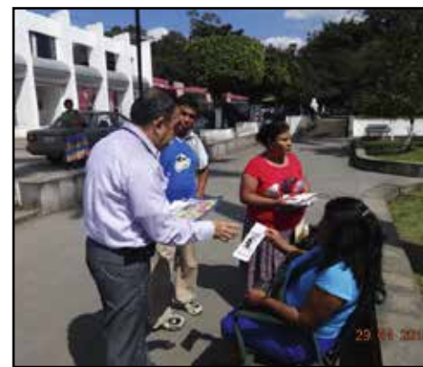
El Delegado en Córdoba, durante la campaña de difusión publicitaria en Tezonapa, Ver.