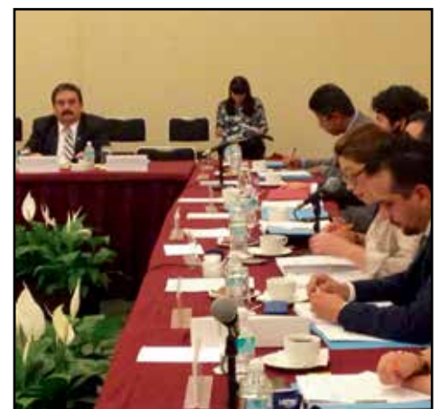
El Titular de la CEDHV, durante la cuarta sesión ordinaria de la Subcomisión Consultiva de la Comisión Intersecretarial para Prevenir, Sancionar y Erradicar los delitos en materia de Trata de Personas y para la Protección y Asistencia a las Víctimas de estos Delitos.