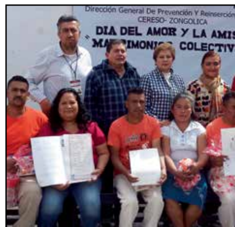
El Delegado étnico en Zongolica, participó en la Ceremonia de Matrimonios Colectivos en el Ce.Re. So. de Zongolica, Ver.