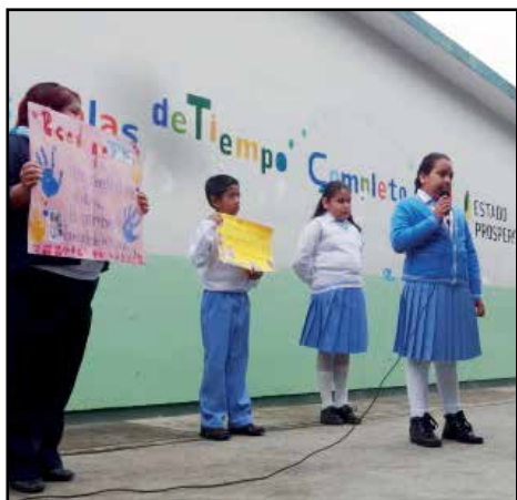
Niños y niñas de la Primaria "Ignacio Zaragoza" en Los Mangos, durante la exposición de los Guiones de los Espacios de la Niñez .

JAMES P. GRANT EX-DIRECTOR EJECUTIVO DEL FONDO DE EMERGENCIA INTERNACIONAL DE LA INFANCIA DE LAS NACIONES UNIDAS