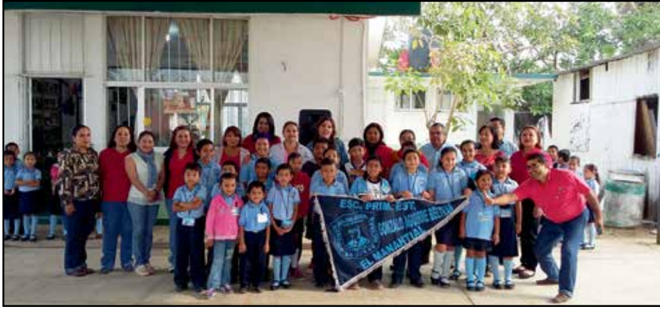
Niños y niñas de la Primaria Federal "Gonzalo Aguirre Beltrán" de la ciudad de Coatzacoalcos, beneficiados con el Programa "Niños Promotores" realizado en coordinación con la CNDH.