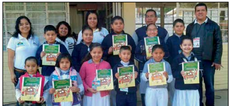
Alumnos/as de la Primaria "Ramón Espinosa Villanueva" de Papantla, Ver., participaron en el Programa "Niños Promotores de Derechos Humanos".