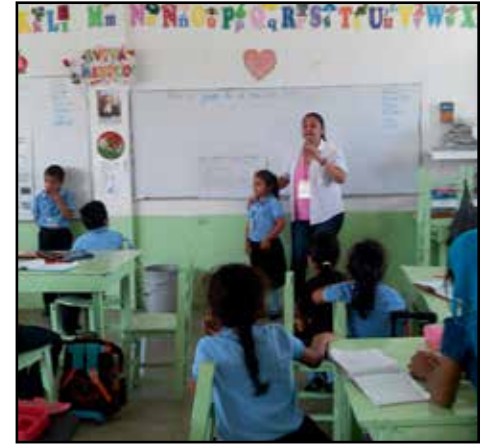
La Delegada en Coatzacoalcos, durante el desarrollo de las actividades del Programa "Niños promotores" en la Primaria "Jesús García Corona" de Coatzacoalcos, Ver.