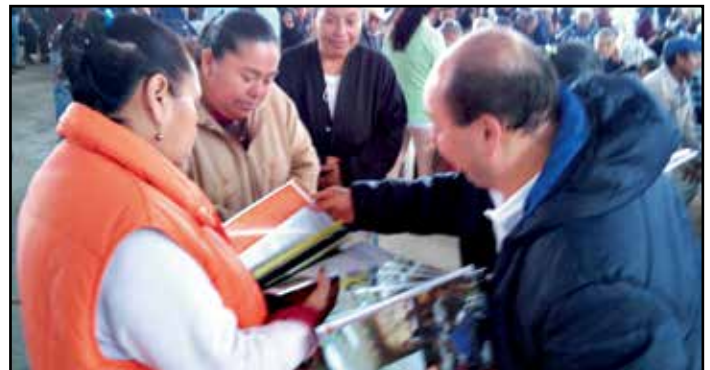
Personal adscrito a la Secretaría Ejecutiva en coordinación con la SEDE-SOL, instalaron un Módulo de difusión en la localidad de Plan de Arroyos, Atzacán, Ver.