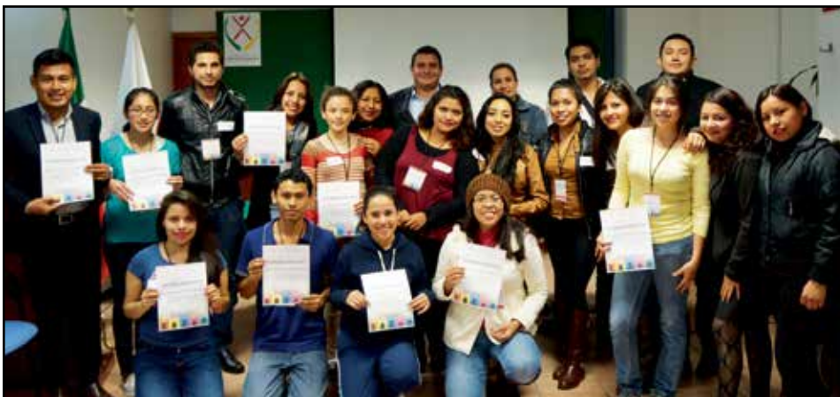
Las y los jóvenes de diversas instituciones educativas como son la Universidad Veracruzana, el Instituto Tecnológico Roosevelt, el Telebachillerato de la Col. Higueras, entre otros, que participaron en el curso de capacitación a los cuales se les acreditó como Jóvenes Promotores de Derechos Humanos.