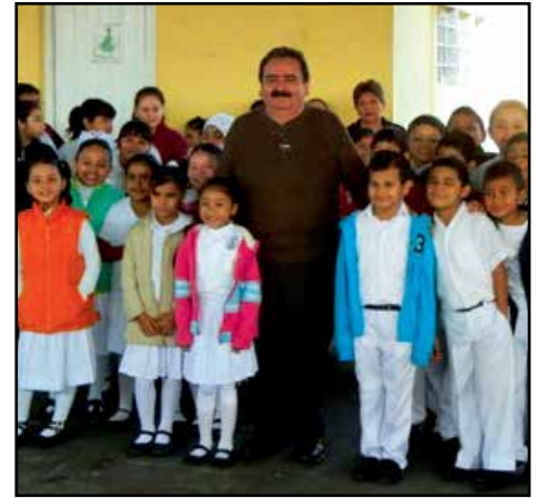
Niñas y niños de la escuela "Tablajeros N°1" de la ciudad de Veracruz, durante la visita que hiciera el titular del organismo defensor de los derechos humanos en Veracruz.