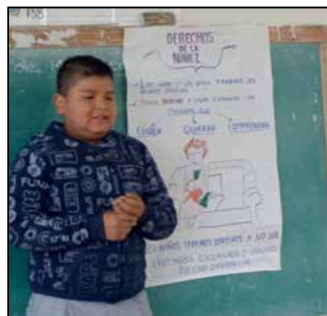
Niño promotor realizando la exposición sobre los Espacios de la Niñez en la Primaria rural "Justo Sierra" de Lindero Agua Fria, Chicontepec, Ver.