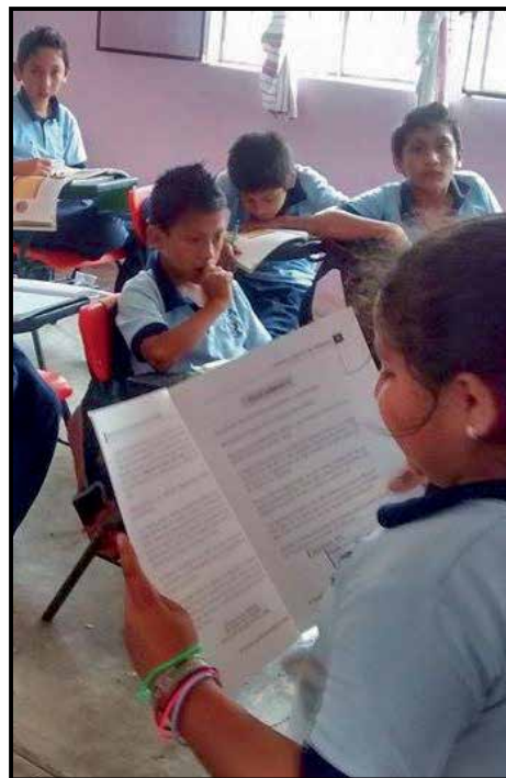
Niña promotora de la Primaria "Vicente Guerrero" de Tuxpan, Ver., durante la exposición de los Guiones de los Espacios de la Niñez.