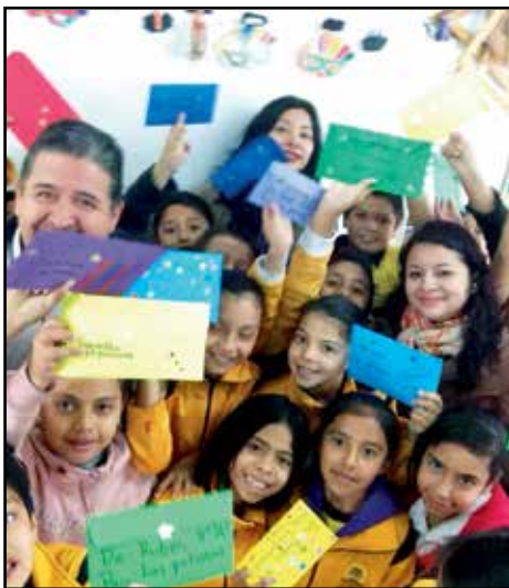
Niñas y niños de cuarto grado de la Primaria “Joaquín H. Servín Andrade” en Xalapa, Ver.