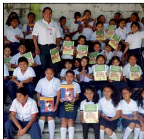
Niños y niñas promotores de la Primaria "Vicente Guerrero" en Sayula de Alemán, Ver.