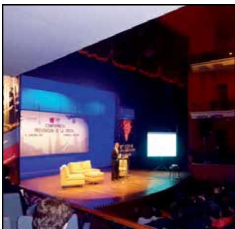
Aspectos de la Conferencia “Prevención de la trata”, organizada por la Diputada federal Lety López Landero, Presidenta de la Comisión Especial de Lucha contra la Trata de Personas de la LXII Legislatura, Cámara de Diputados.

El distinguido conferenciante habló sobre la importancia de trabajar en la búsqueda de consensos, necesarios para alcanzar la libertad y la paz. La exposición estuvo dirigida al personal de la Comisión, integrantes de organizaciones civiles de Veracruz y juventudes