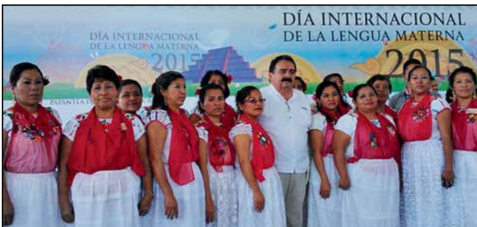
Presidente de la CEDHV, durante el evento del Día Internacional de la Lengua Materna realizado en Papantla, Ver.