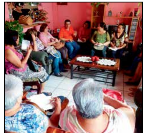
El Delegado en Papantla, durante el curso de capacitación impartido a integrantes de la organización Liderazgo Indígena para Mujeres Kintiji, A.C.