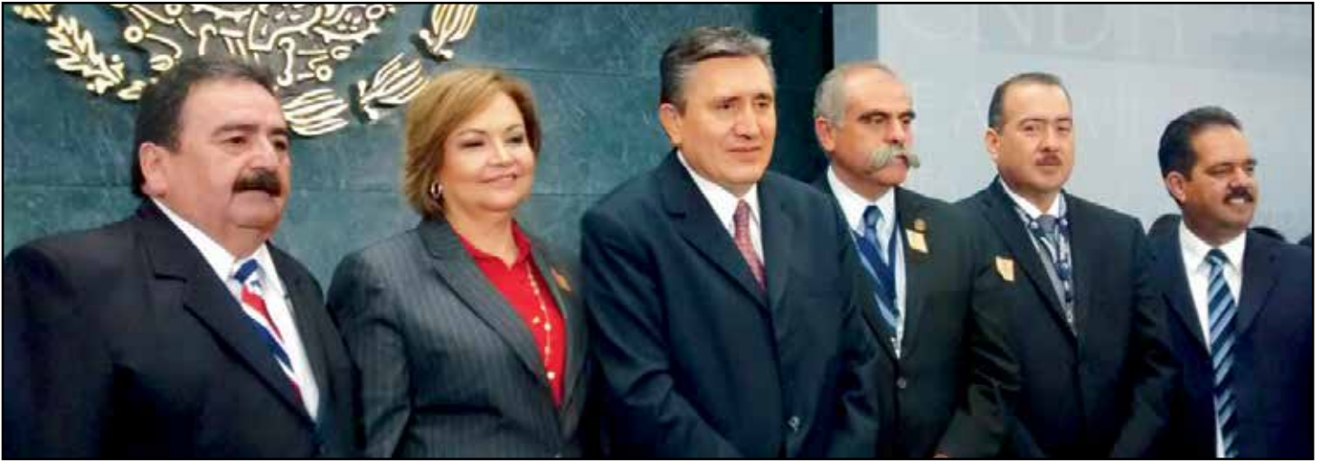
Titulares de organismos públicos del Derechos Humanos del país, con el Dr. Luis Raúl González Pérez, Presidente de la CNDH, con motivo del Informe Anual de Actividades de la Comisión Nacional de los Derechos Humanos.