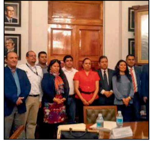
Participantes de la reunión de trabajo convocada por la Dirección General de Atención a Migrantes del Gobierno del Estado de Veracruz.