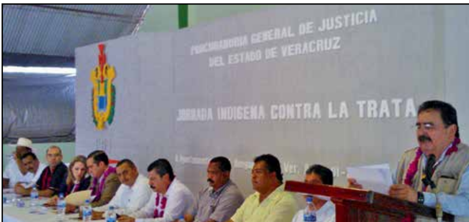
El presidente de la CEDHV, dirigiendo un mensaje a los asistentes de la Jornada Indígena contra la Trata, organizada por la Fiscalía General del Estado.

El año 2015, que marca el 15º aniversario del Día Internacional de la Lengua