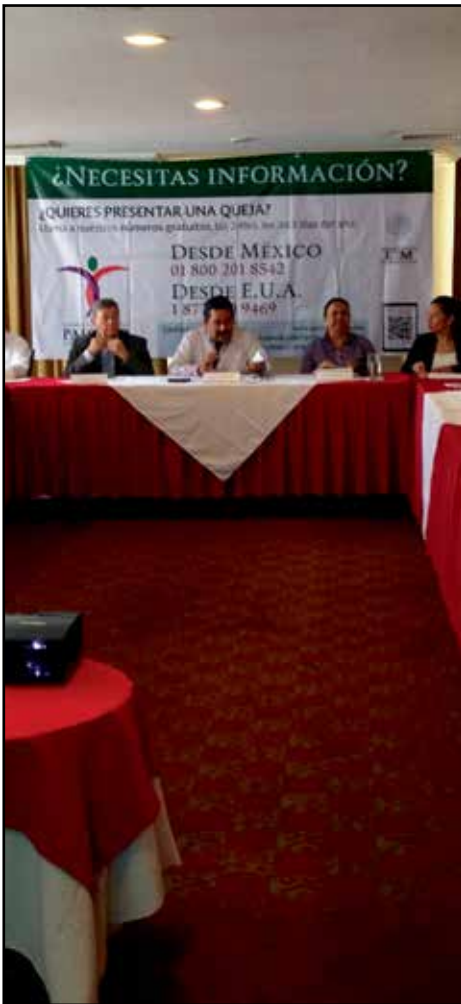
Reunión del Comité del Programa Paisano de Semana Santa 2015, organizada por la Delegación Federal en Veracruz del INM.