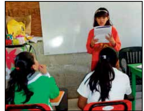
Jóven Promotora de la Telesecundaria de la colonia Luis Salas García de Papantla, Ver.

de distintas áreas de la Comisión reiteraron su apoyo y alentaron a las y los jóvenes a promover y difundir sus nuevos conocimientos, para así contribuir a una sociedad no violenta, tolerante y respetuosa de los derechos humanos.