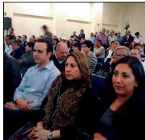
Primer Visitador General y la Directora de Atención a Mujeres, Grupos Vulnerables y Víctimas durante el Informe Anual de Actividades del Delegado Estatal del Instituto de Seguridad y Servicios Sociales de los Trabajadores del Estado.