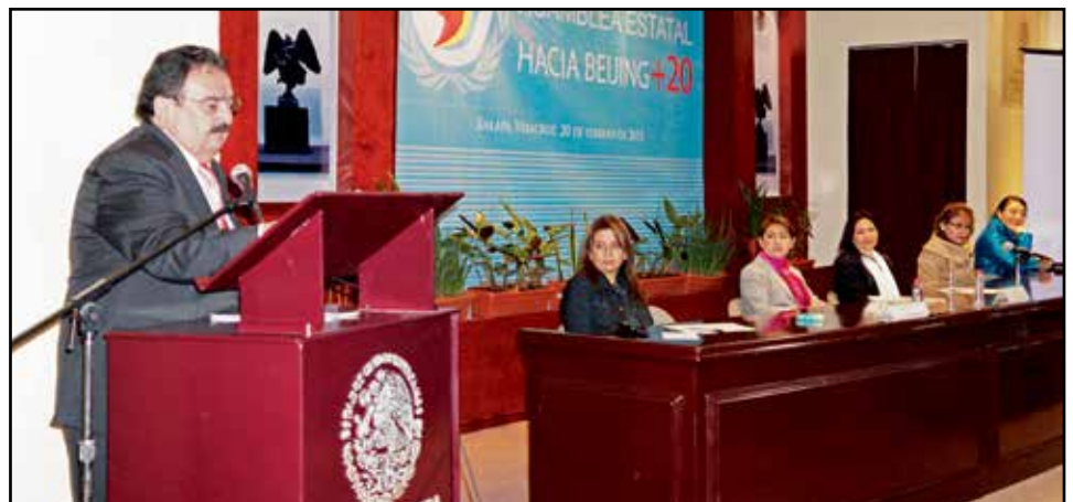
El Presidente de la CEDHV, al momento de inaugurar la Asamblea Estatal hacia Beijing +20 en el H. Congreso del Estado de Veracruz.