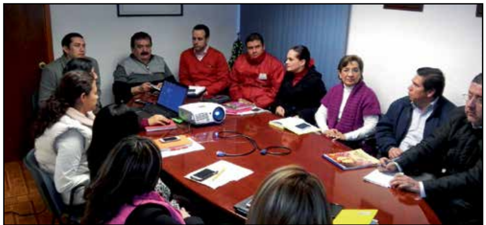
Titulares de las diferentes áreas que integran la Comisión Estatal de Derechos Humanos de Veracruz, durante la reunión de trabajo para coordinar el inicio de las actividades comprometidas en el Programa Operativo Anual del año 2015.