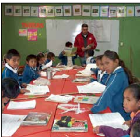
Niñas y niños Promotores de la primaria "20 de noviembre" de Barrio Segundo, Mixtla de Altamirano, Ver., desarrollando actividades del Guión "Espacios de la niñez"