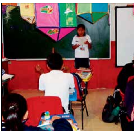
Niños y niñas durante la sesión del Programa Niños Promotores, implementado en la Primaria "Benito Juárez" de Carrizal, Papantla, Ver.