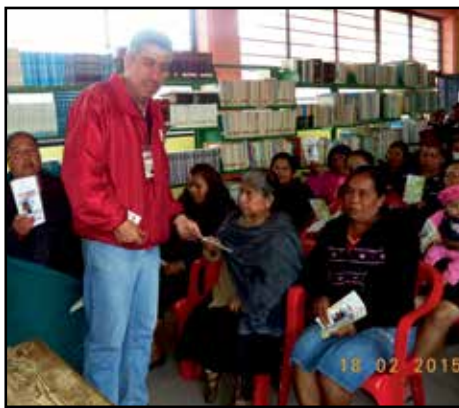
El Delegado en Zongolica, durante el Curso “Prevención del Acoso Escolar o Bullying” a padres de familia del TEBAEV de Magdalena, Ver.