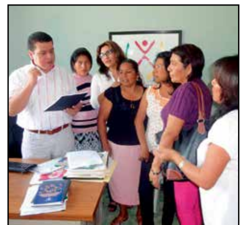
El Delegado étnico en Papantla de la CEDHV, recibió a mujeres lideresas de la región del Totonacapan