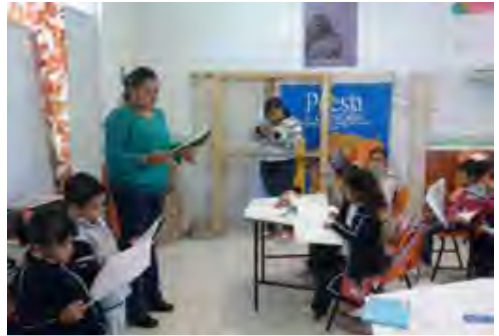
Segunda Sesión del Programa Niños Promotores en la escuela rural "Artículo 3o Constitucional" de Tuxpan, Ver.