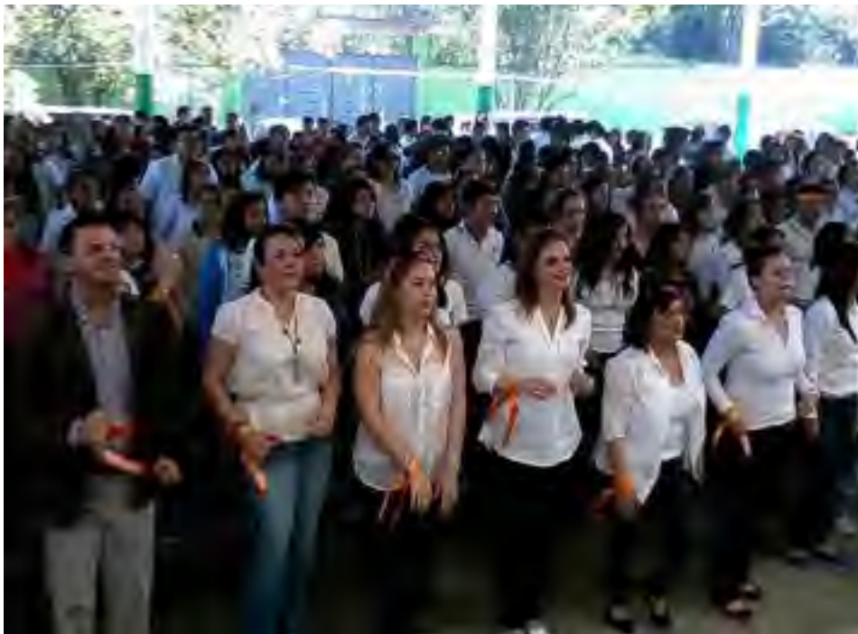
La titular de la Unidad para la Igualdad de Género de la CEDHV, participó de las acciones contra la violencia “Un billón de pie 2014”, en el COBAEV 35 de la Ciudad de Xalapa, Ver.

Se tiene dentro del Programa “Atención a mujeres e igualdad de género” acciones transversales para el logro y construcción paulatina de la igualdad entre hombres y mujeres, el cual es desarrollado por las delegaciones regionales y étnicas y por todas las áreas que integran la Comisión Estatal de Derechos Humanos de Veracruz. Asimismo, impulsa mediante los distintas instancias de vinculación el apoyo, colaboración y/o coadyuvancia en el reconocimiento formal de la mujer, como un pilar fundamental en la sociedad, así como otorgarle la protección de sus derechos.