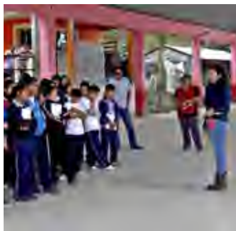
En coordinación con la Dirección de Promoción y difusión de los derechos humanos de los pueblos y comunidades indígenas de la Cuarta Visitaduría General de la CNDH, se impartió la plática “Violencia en el Noviazgo” en la Telesecundaria “Rafael Ramírez Castañeda” de La Llave municipio de Tlachichilco, Ver.