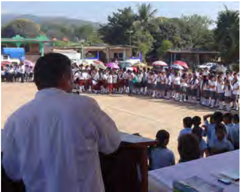
El Delegado étnico en Acayucan impartió en el municipio de Mecayapan una plática en materia de derechos de los indígenas en el marco de la conmemoración del Día Internacional de la Lengua Materna.