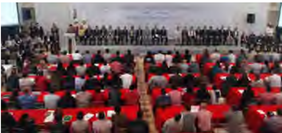
Evento de Capacitación a Presidentas y Presidentes Municipales organizado por la SEDESOL y el Gobierno del Estado, donde fue entregada la "Guía de Derechos Humanos para Municipios 2014".