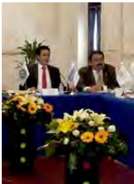
Primera Reunión de Trabajo de la Zona Este de la FMOPDH