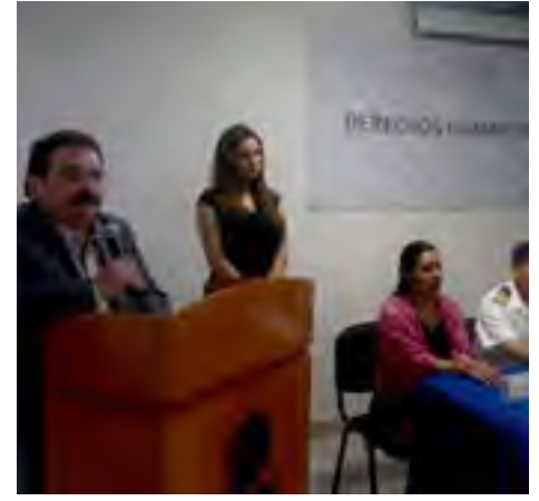
Curso "Capacitación sobre Derechos Humanos y Uso Legítimo de la Fuerza" implementado por la Procuraduría General de la República.