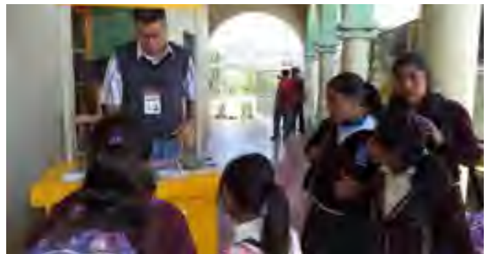
Módulo Itinerante de Atención en palacio municipal de Tlaquilpa, Ver.