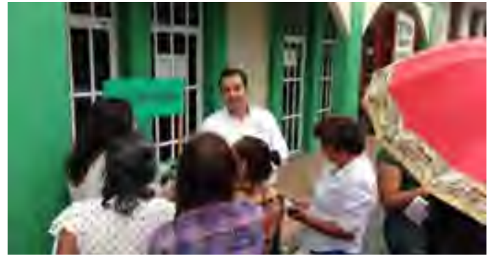
Módulo Itinerante de Difusión en Soledad de Doblado, Ver.