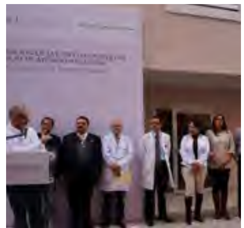
Inauguración de las nuevas instalaciones del Servicio de Atención Integral (SAI), ubicadas en el Hospital Dr. Luis F. Nachón en Xalapa, Ver.