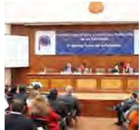
Primer Informe de labores de la Comisión Estatal para la Atención y Protección de los Periodistas.