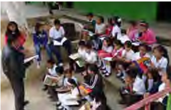
Cuarta Sesión del Programa Niños Promotores en Primaria "Justo Sierra" de Acayucan, Ver.