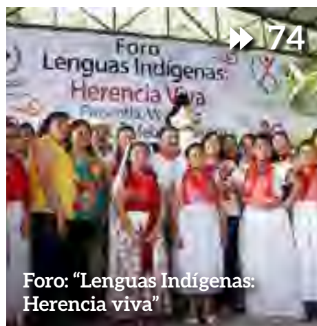
Foro: "Lenguas Indígenas: Herencia viva"