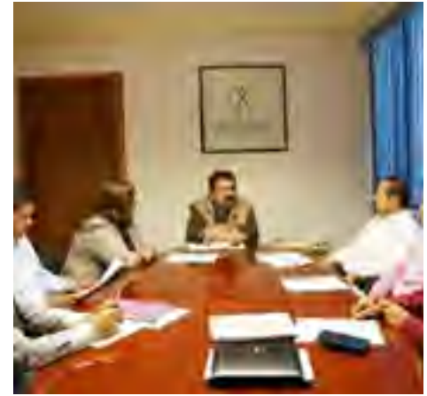
Reunión con integrantes de la Comisión de Promoción y Defensa de los Derechos Humanos de Papantla.

Gobierno del Estado, Secretaria del Trabajo y Universidad Veracruzana. El Presidente de la Comisión asistió el 14 de marzo a la firma del “Convenio de Colaboración