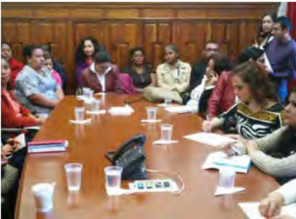
En el Salón Ruiz Cortines del Palacio de Gobierno del Estado de Veracruz se llevó a cabo la presentación de la “Estrategia de convergencia interinstitucional y comunitaria con Perspectiva de Género para mujeres en migración”