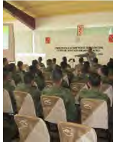
Personal de la Secretaría Ejecutiva impartió capacitación a elementos de tropa y oficiales del 63/o Batallón de Infantería, destacamentos en el campo militar de El Lencero, congregación del municipio de Emiliano Zapata, Ver.