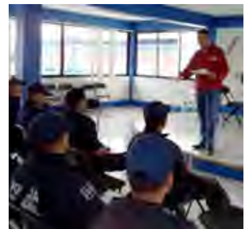
Curso de capacitación "Derechos humanos, Atribuciones, Derechos y Deberes de los Policías" para policías municipales de Mixtla de Altamirano, Ver.