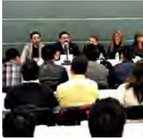
Taller "Criterios para elaborar el Plan Municipal de Desarrollo".