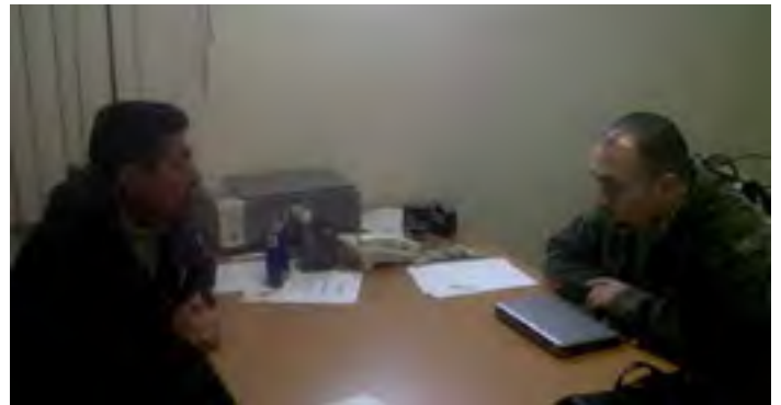
En coordinación con la Dirección Municipal de Derechos Humanos de Poza Rica se instaló un módulo de atención.