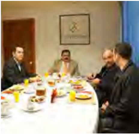
El titular de la CEDHV y el Primer Visitador General en reunión de vinculación con representantes de diversas cámaras empresariales, para coordinar actividades de apoyo mutuo en la difusión de la cultura del respeto a los derechos humanos.