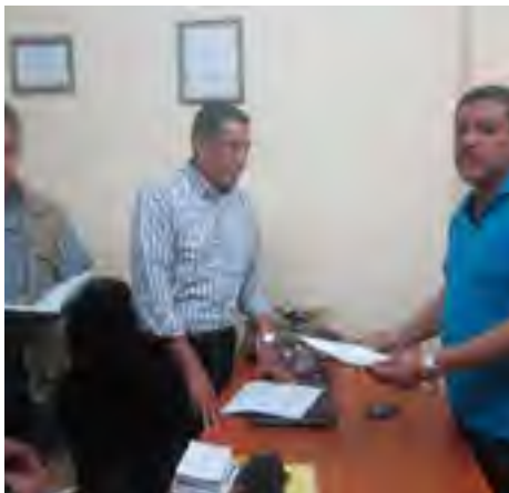
Supervisión al Ce.Re.So. de San Andrés Tuxtla, Ver.