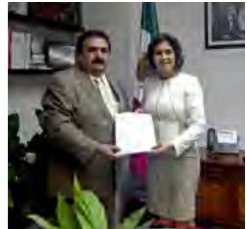
Reunión de trabajo donde se hizo entrega a la Diputada Anilú Ingram Vallines, Presidenta de la Mesa Directiva de la LXIII Legislatura del Congreso del Estado de Veracruz, de la iniciativa de Reformas y Adiciones a la Ley 483 de la CEDHV.