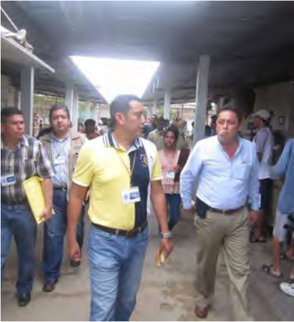
Supervisión al Ce.Re.So. de Coatzacoalcos, Ver.

La CEDHV monitorea de forma continua las condiciones operativas y administrativas de cárceles preventivas y centros de detención.