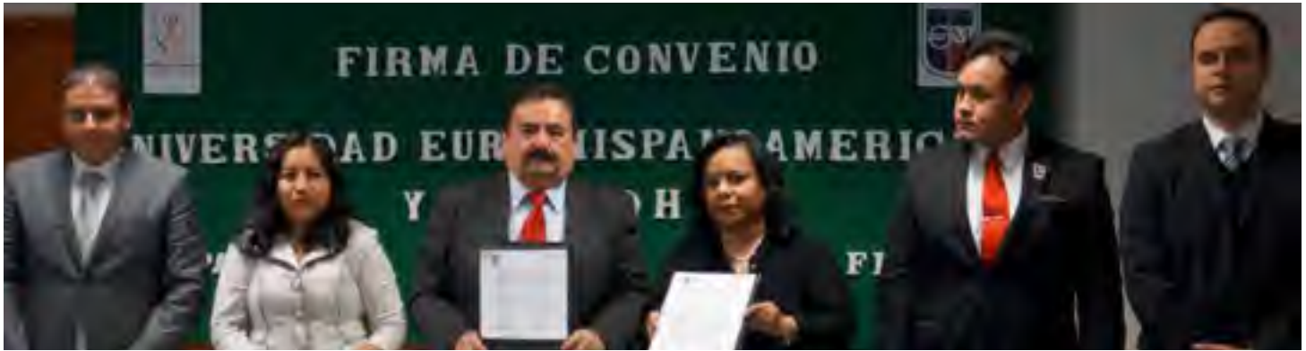
Acto Protocolario de la firma del convenio de Colaboración con la Universidad Euro Hispanamericana