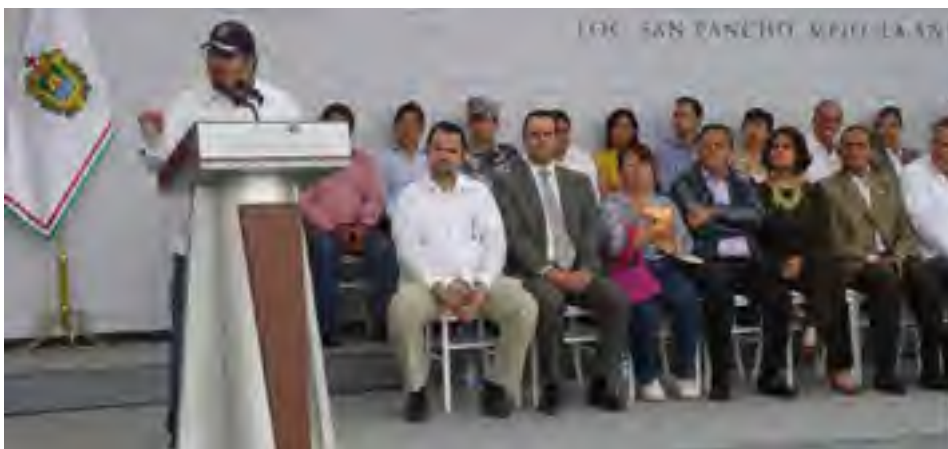
El Primer Visitador General, Geiser Manuel Caso Molinari, asistió a la inauguración del Cuartel de Policía del Agrupamiento Tajín y Policía Estatal de Caminos, perteneciente a la Secretaría de Seguridad Pública del Estado, ubicado en la localidad San Pancho, Mpio. de La Antigua, Ver.