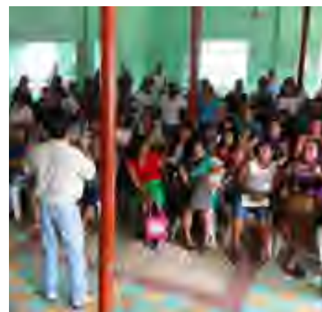
Plática “Derechos Humanos y Derechos de los Pueblos Indígenas”, dirigida a personas de diferentes localidades y ejidos que pertenecen a Hueyapan de Ocampo, Ver.

Delegación étnica en Papantla. El 4 de fe-