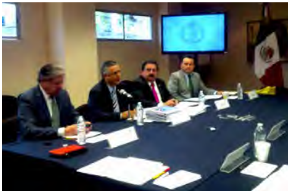
Primera Reunión de Trabajo del Comité Directivo de la FMOPDH