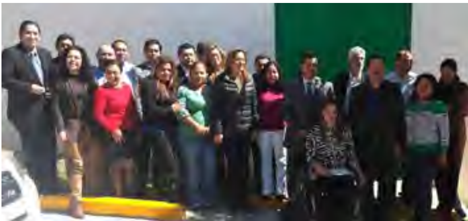
Personal de las diferentes instancias que participaron de la séptima reunión del Comité del Parlamento de las Niñas y los Niños de México 2013.