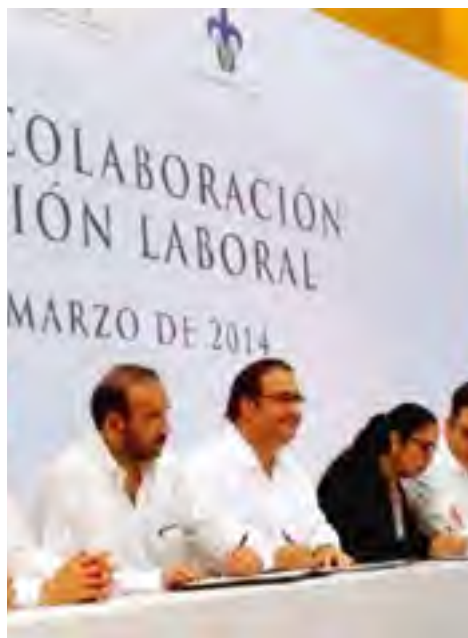
Acto protocolario de la firma del "Convenio de Colaboración en Materia de Inclusión Laboral" entre el Gobierno del Estado de Veracruz, la Secretaría del Trabajo y Previsión Social y la UV.