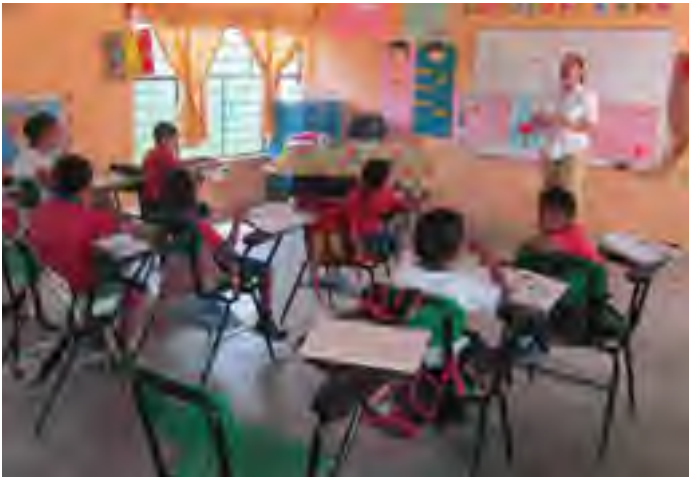
Segunda Sesión del Programa Niños Promotores en la Primaria "Mercedes Peniche de Cáceres" en Coatzacoalcos, Ver.

En la Primaria "Albino R. González" se impartieron sesiones el 10 de febrero, 14 de febrero, 5 de marzo, y 24 de marzo, lo cual benefició a un total de 60 niños y niñas promotores.