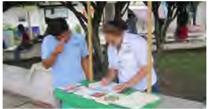
Módulo Itinerante de Atención instalado en Villa Cuichapa municipio de Moloacan, Ver.