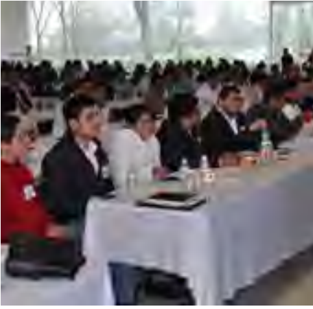
Mesas de trabajo del Programa de capacitación "Facultades y obligaciones del Síndico Municipal" organizado por la Secretaría de Gobierno en Xalapa, Ver.