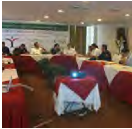
El Delegado regional en Veracruz, y el titular de la Unidad de Atención a Migrantes en la reunión de trabajo convocada con motivo del "Operativo Semana Santa 2014"