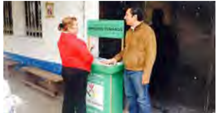
Módulo Itinerante de Atención instalado afuera del Ce.Re.So. Morelos en Cosamaloapan, Ver.