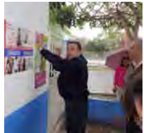
Instalación de carteles "Di No a la Violencia Escolar" en la Escuela Primaria Mixta "Melchor Ocampo" del municipio de Carrillo Puerto, Ver.