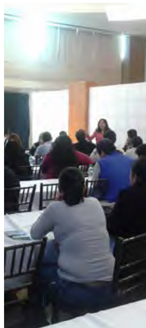
Las Secretarías Ejecutiva y Técnica de la CEDHV impartieron capacitación a regidores y regidoras de las Comisiones Municipales de Promoción y Difusión de los Derechos Humanos, asimismo hicieron entrega de la "Guía de Derechos Humanos para Municipios".

Ejemplares de esta guía han sido entregados durante los eventos realizados por el Instituto Veracruzano de Desarrollo Municipal, en 212 municipios de la entidad veracruzana, así como en las diversas actividades regionales que la CEDHV ha realizado con personal de los ayuntamientos. Su contenido se propone contribuir a la labor de las autoridades municipales con pleno respeto de los derechos humanos de las personas a las que están obligadas a atender y respetar. Además de un panorama general del concepto, características y alcances de los derechos humanos, esta guía presenta las atribuciones de los municipios en materia de derechos humanos y de la transversalización de la perspectiva de género. Se estructura en cinco apartados: