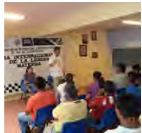
Plática “Día Internacional de la Lengua Materna y Derechos Indígenas” dirigida a internos del Ce.Re. So. de Zongolica, Ver.