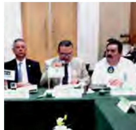
Primera Reunión de Trabajo de la Zona Norte de la FMOPDH