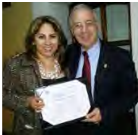
La Directora de Atención a Mujeres, Grupos Vulnerables y Víctimas recibió a nombre del Mtro. Perera Escamilla un reconocimiento por el apoyo en la realización del 4º Diplomado "Atención a la Discapacidad: Un Modelo de DDHH y Ciudadanía"