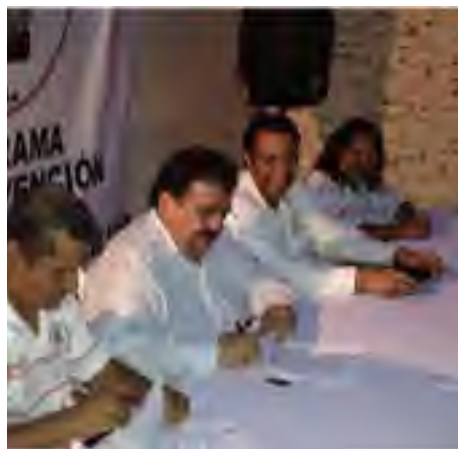
Firma de convenio de colaboración entre la CEDHV y la Asociación Civil "Recuperación contra las Drogas y el Alcoholismo del Estado de Veracruz"