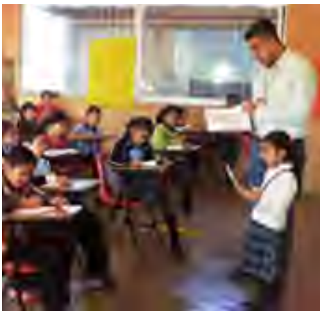
Cuarta Sesión Programa Niños Promotores en la Escuela Primaria Rural "Francisco Primo Verdad" en Atecoxocua municipio de Zongolica, Ver.

En la Primaria "20 de Noviembre", turno matutino, los materiales didácticos fueron entregados el 11 de marzo, y los días 19 y 26 de marzo se realizaron las dos primeras sesiones en esta institu-