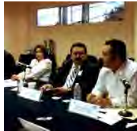
Primera Reunión de Trabajo de la Zona Sur de la FMOPDH

En las reuniones se trataron temas relacionados con el fortalecimiento de los organismos protectores de derechos humanos en las entidades federativas y se hicieron pronunciamientos respecto de actos que afectan su autonomía.