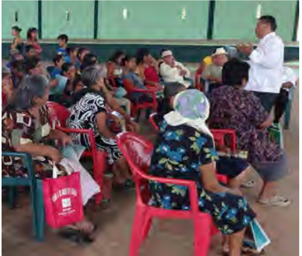
Delegado étnico en Acayucan, impartió una plática en materia de derechos humanos y derechos de los pueblos indígenas a mujeres Popolucas del municipio de San Pedro Soteapan, Ver.