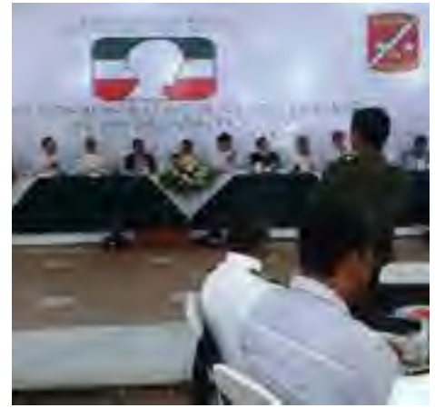
La Delegada Regional en Coatzacoalcos asistió en representación de la CEDHV a la Conmemoración del Día del Ejército Mexicano en las instalaciones del 3/er batallón de infantería ubicado en la ciudad de Minatitlán, Ver.