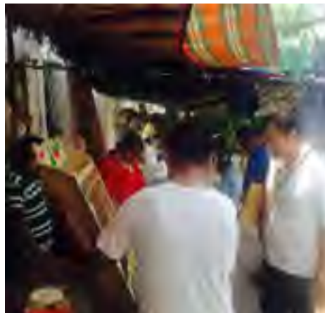
Supervisión al Ce.Re.So. Morelos de Cosamaloapan, Ver.