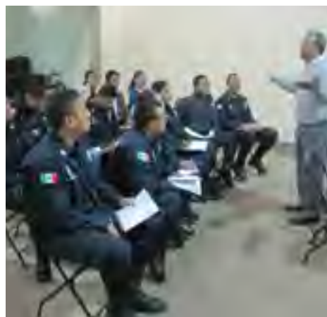
Taller "Seguridad Pública y derechos humanos" a policías municipales del municipio de Coatepec, Ver.

Los cursos de capacitación que imparte la Comisión Estatal de Derechos Humanos de Veracruz a las servidoras y servidores públicos tienen como propósito brindarles conocimientos especializados que les permitan desempeñarse mejor en el ámbito de sus funciones, cuidando en todo momento el respeto a los derechos humanos. Por tal motivo, se cuenta con un programa permanente de formación y actualización.