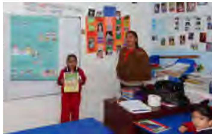
Niñas y niños promotores de derechos humanos Primaria "Ana Francisca de Irivás (MASCARON)" de Córdoba, Ver.