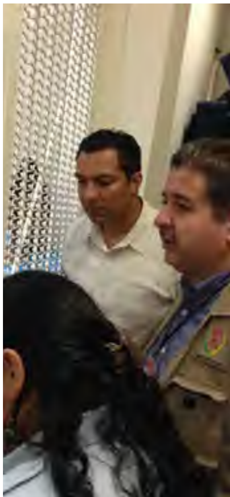
El Delegado regional en Veracruz, y el titular de la Unidad de Atención a Migrantes, en la visita practicada a las instalaciones de la Estación Migratoria en la ciudad de Veracruz.

vilidad Humana de la Arquidiócesis de Xalapa. La reunión tuvo como objetivo intercambiar experiencias relacionadas con el tema migratorio, así como estrechar vínculos de colaboración que incidan directamente en una mejora a las condiciones de vida de las personas migrantes en tránsito por la región de Xalapa.