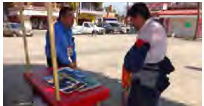
Módulo Itinerante de Atención instalado en Cuitláhuac, Ver.