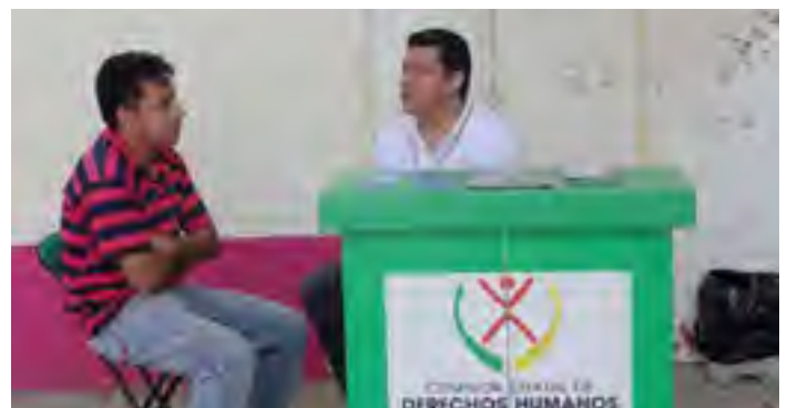
Módulo Itinerante de Atención instalado en el Hospital Integral "Melchor Ocampo" de la ciudad de Gutiérrez Zamora, Ver.