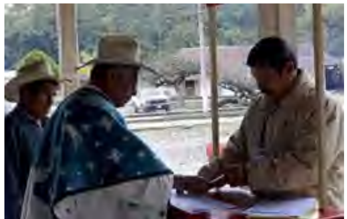
Módulo Itinerante de Atención instalado en Cuatecomaco, Municipio de Zontecomatlán, Ver.