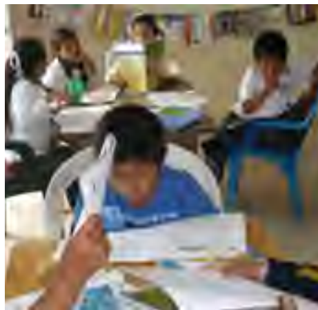
Séptima Sesión del Programa Niños Promotores en Escuela Primaria Indígena "Francisco Javier Clavijero" de Zozocolco de Hidalgo, Ver.