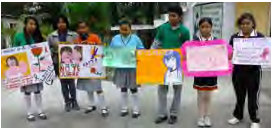
Participantes del concurso de carteles alusivos a los derechos de la mujer, que contó con intervención de diversas escuelas secundarias de la región de Tuxpan.