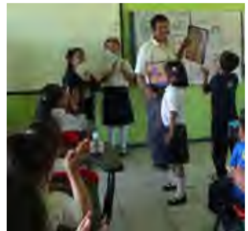
Cuarta Sesión del Programa Niños Promotores de la Primaria Bilingüe "José Vasconcelos" de la localidad de Colatlán, municipio de Ixhuatlán de Madero, Ver.