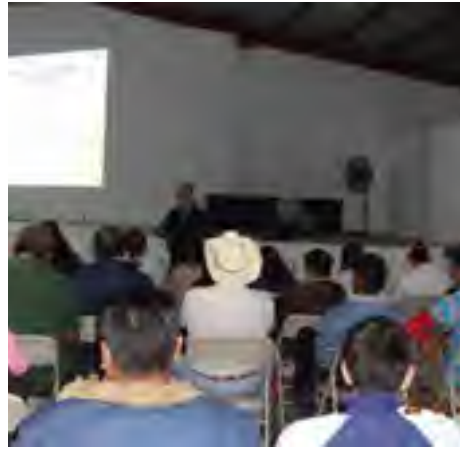
El Delegado regional en Córdoba, impartió una plática con los temas "Historia de los Derechos Humanos y Funciones, Competencia y Atribuciones de la CEDHV" a servidoras y servidores públicos del Ayuntamiento de Carrillo Puerto, Ver.