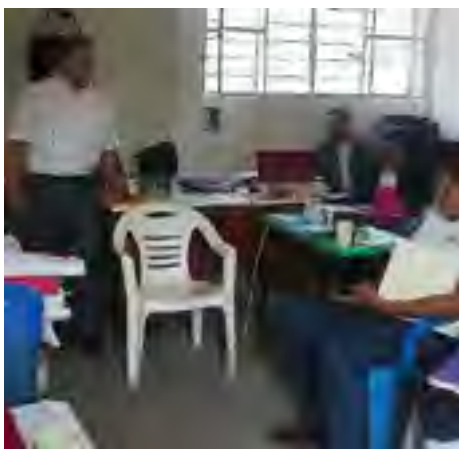
Reunión de trabajo para coordinar acciones que promocien la cultura de respeto de los derechos humanos en la congregación de Zozocolco de Guerrero, Papantla, Ver.