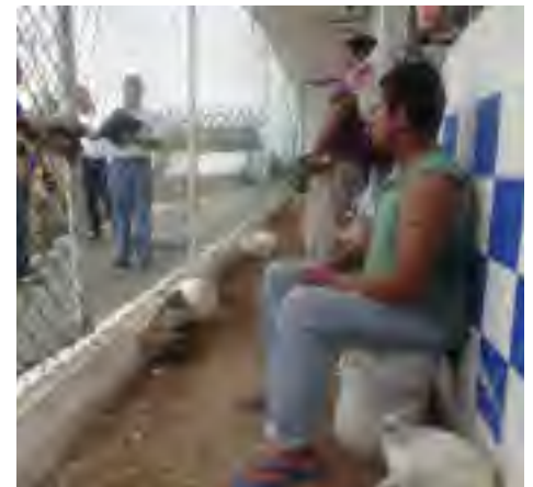
Supervisión al Ce.Re.So. de Papantla, Ver.