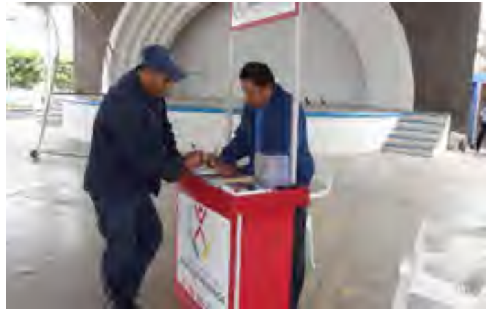
Módulo Itinerante de Atención en Texistepec, Ver.