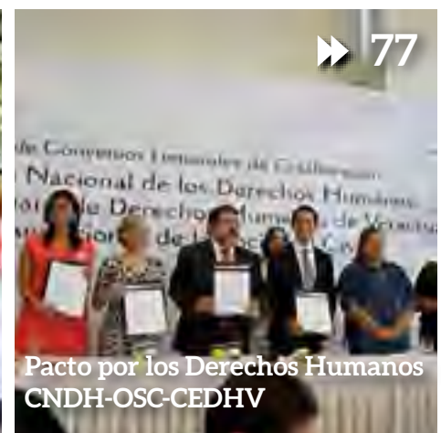
Pacto por los Derechos Humanos CNDH-OSC-CEDHV