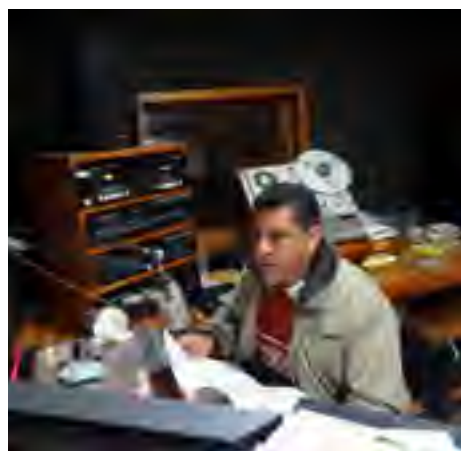
Programa de radio “Comunicando Derechos Humanos”, por medio del cual la CEDHV, difunde los derechos humanos para la región del Totonacapan en español y totonaco.