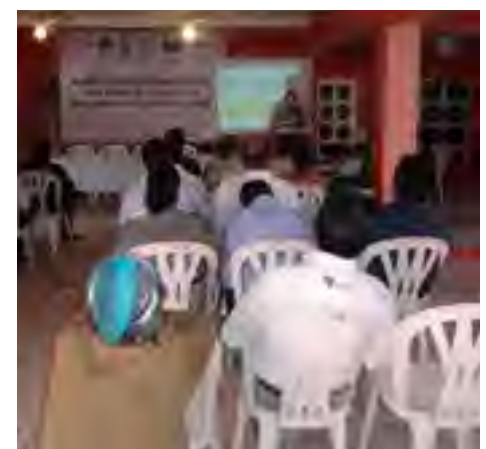
Reunión para el “Análisis de Consistencia y Validación Técnica” para la formulación de los planes de desarrollo municipal en Papantla, Ver.

El Delegado étnico en Papantla de la CEDHV participó en las acciones del “Análisis de Consistencia y Validación Técnica” que la coordinación regional de la Comisión Nacional para el Desarrollo de los Pueblos Indígenas realizó en la ciudad de Papantla el 18 de marzo, para la formulación de los planes de desarrollo municipal de los municipios Filomeno Mata, Mecatlán y Papantla.