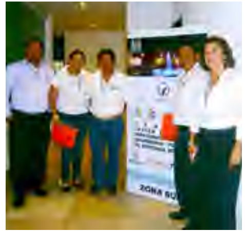
Personal de la CEDHV participantes en el Tercer Taller Regional para Capacitadores de Organismos Públicos de Derechos Humanos organizado por la CNDH en Campeche, Camp.