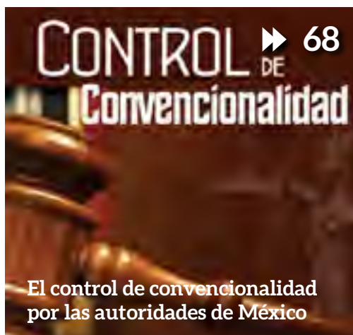
El control de convencionalidad por las autoridades de México