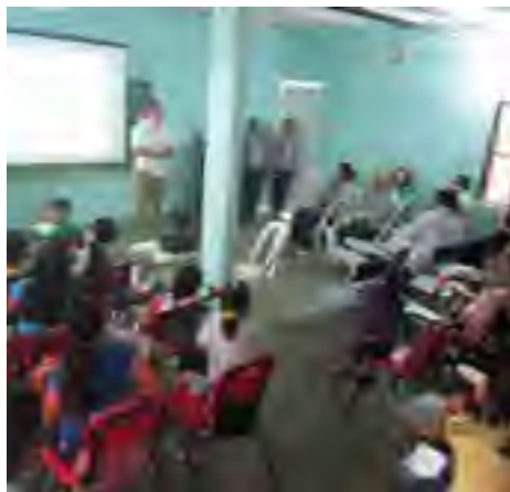
La Delegada en Coatzacoalcos, impartió una plática sobre Trata de personas en Primaria del ejido "Pollo de Oro", municipio de Nanchital, Ver.