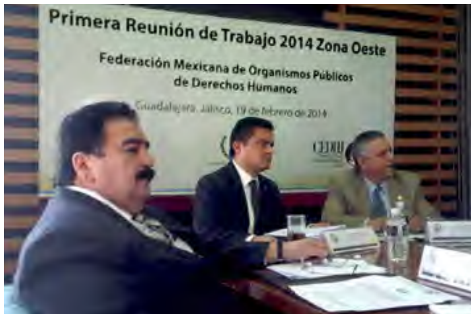
Primera reunión de trabajo 2014 Zona Oeste de la FMOPDH