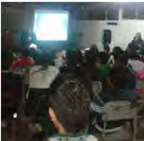
El titular de la Unidad de Atención a Migrantes impartió la conferencia sobre los "Derechos Humanos de las personas migrantes o movilizadas" a estudiantes de la Escuela de Bachilleros "Artículo 3ro. Constitucional" de Xalapa, Ver.