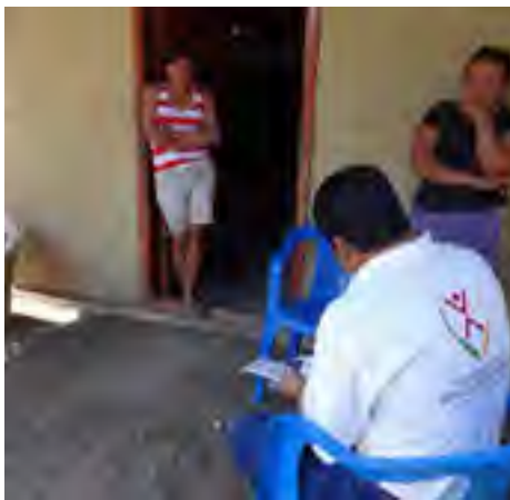
El Delegado étnico en Chicontepec realizó una visita de atención a la comunidad indígena de Cuamixtepec, municipio de Chicontepec, con el propósito de ofrecer los servicios que presta la CEDHV.