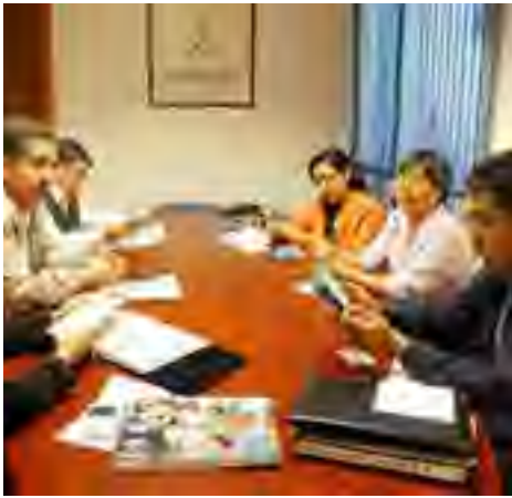
Reunión de trabajo con la Pastoral de la Movilidad Humana de la Arquidiócesis de Xalapa, la cual tuvo como objetivo intercambiar experiencias relacionadas con el tema migratorio.