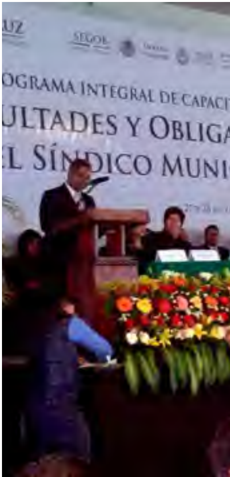
Programa de capacitación "Facultades y obligaciones del Síndico Municipal".

La preparación es el único camino para servir adecuadamente. La actualización continua permite a las y los servidores públicos atender con eficacia.